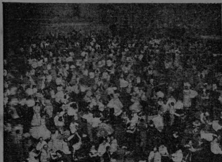
Esta es tan sólo una vista parcial del cuadro que ofrecieron más de diez mil personas que acudieron a la Cuarta Convención Anual de Baile de Cuadrillas en Oklahoma City, Oklahoma, para tomar parte en el evento que sorprendió, por su magnitud, al auditorio de la televisión norteamericana.

Era un sábado de hace pocas semanas cuando los dueños de televisores en los Estados Unidos, incluyendo a los que tienen aparatos con color, encendieron sus instrumentos y vieron un espectáculo totalmente nuevo para los auditorios de la TV: miles de parejas bailando.